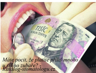
Máte pocit, že platíte příliš mnoho u svého zubaře? - Katalog-stomatologu.cz

Pokud zubní náhrada v ústech přesně nesedí, může v ústní dutině vytvářet